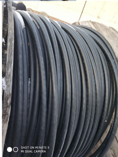
Барабан № 3 (574 м)