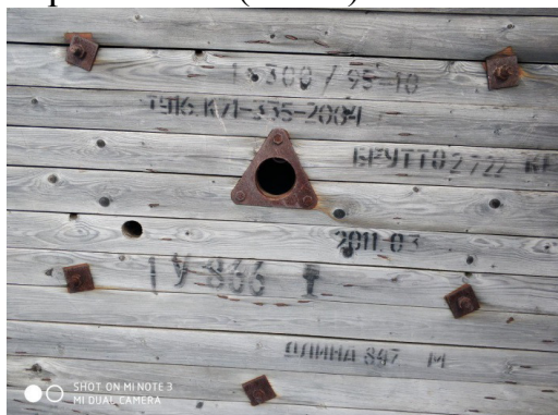
Барaban № 1 (189 м)