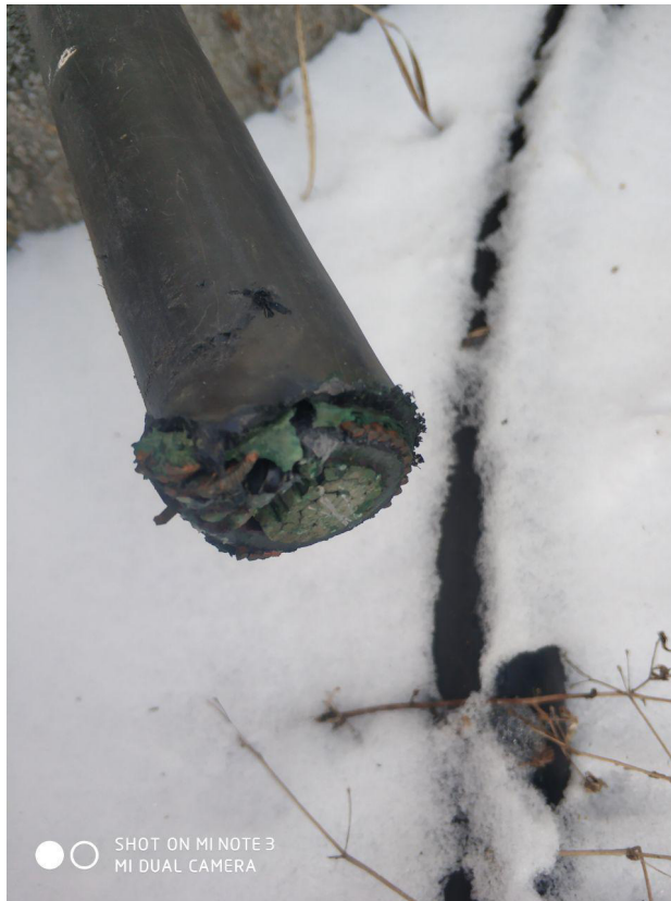
Без барабана (171 м)